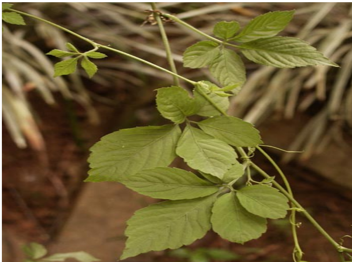
Rys 4. Gynostemma pentaphyllum

Gynostemma (łac. Gynostemma pentaphyllum ) występuje w Chinach, Korei, Japonii i południowo-wschodniej Azji. Jest wieloletnim, liściastym, pnącym ziołem. W ramach tego gatunku istnieje 13 odmian. Wszystkie występują w Azji. W Chinach rośnie 11 odmian, z czego 7 rośnie tylko w Chinach i to właśnie one posiadają zasoby dzikiej Gynostemmy pentaphyllum . Rośnie na dużym obszarze gór Qin Ling i w 15 prowincjach na południe od Jangcy. Uważa się, że najwyższej jakości Gynostemma pochodzi z nadbrzeży rzeki Jangcy (z Regionu Changjiang Gorge), z regionu Shen Nong Jia, z Wu Shan oraz z Xing Dou Shan.